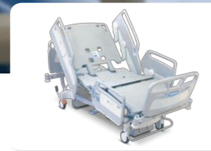
AvantGuard® 1600 Bed

France .....+33 (0)2 97 50 92 12 United Kingdom .....+44 (0)1530 411000 Deutschland .....+49 (0)211/16450-0 Nederland .....+31 (0)347 32 35 32 Italia .....+39 02-950541 Suisse/Schweiz .....+41 (0)21/706 21 30 (deutschsprachig) .....021/706 21 38 Österreich .....+43 (0)2243 / 28550 Ireland .....+353 (0)1 413 6005 España .....+34 (0)93 6856000 Portugal .....+351 210 991 891 Nordic Countries .....+46 (0)8 564 353 60