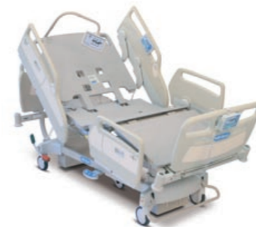
AvantGuard® 1600 Mobility Bed Verbeterde mobilisatie van patiënten

Omdat elke zorginstelling andere eisen stelt, biedt Hill-Rom twee modellen aan: