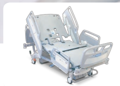
AvantGuard® 1600 Bedden