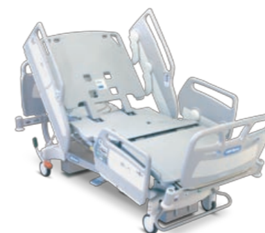
AvantGuard® 1600 Ability bed Verbeterde ergonomie en prestaties