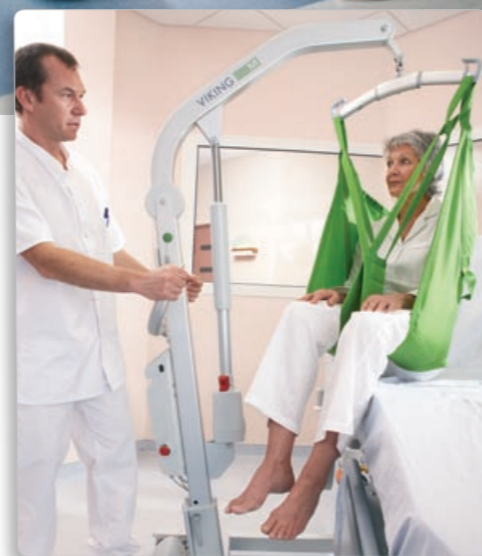
De Liko lift-oplossingen van Hill-Rom helpen je om een veilige til-omgeving te creëren.