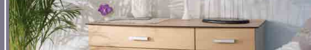
Zanohé, la pureté et la sobriété...