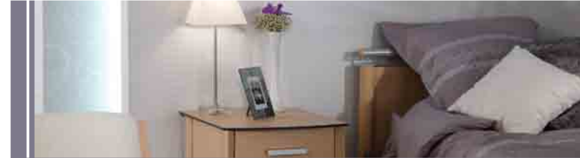
Zanohé, la pureté et la sobriété...