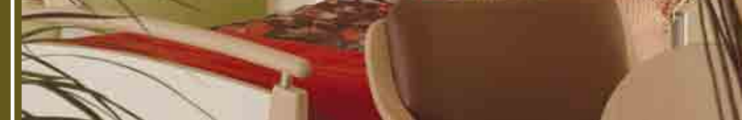
Toocana, l'énergie et la douceur...