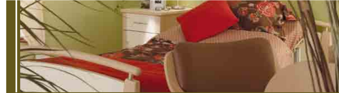
Toocana, l'énergie et la douceur...