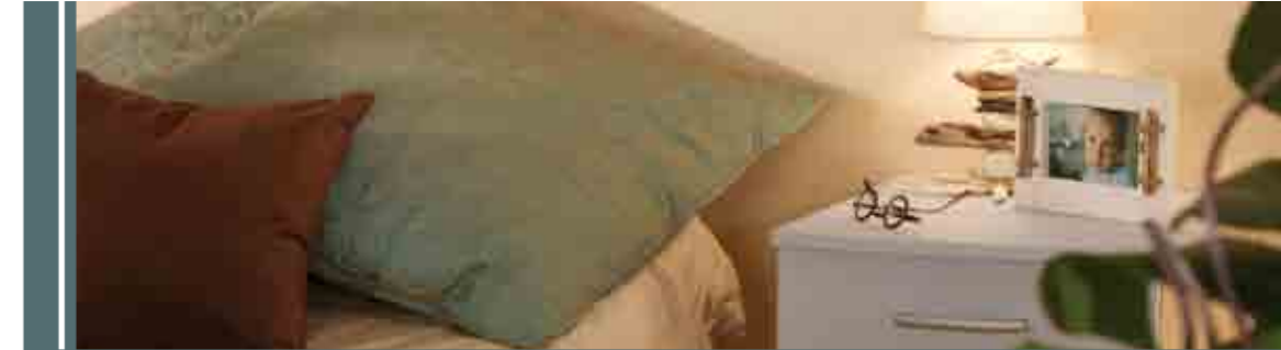
Koati, la simplicité & l'efficacité...