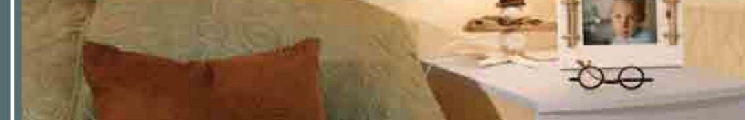
Koati, la simplicité & l'efficacité...