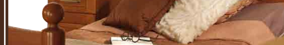
Gwanara, le style et l'élégance...