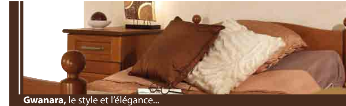
Gwanara, le style et l'élégance...