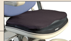
Coussin confort prévention AC 947A.

Commande bilatérale de l'inclinaison du dossier.