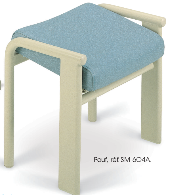
Pouf, réf. SM 604A.

Garniture amovible, roulettes de déplacement