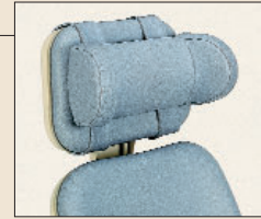
AC 901A Cale-nuque.

Appui-tête anatomique : 3 positions d'inclinaison et escamotable.