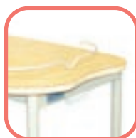
Table TA 529 F : 1 plateau fixe stratifié.