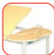
Table TA 529 G : 2 plateaux stratifiés dont 1 réglable en position lecture.