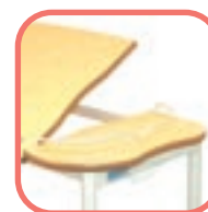
Table TA 529 I : 2 plateaux en médium dessus plaqué stratifié, dont 1 réglable en position lecture.