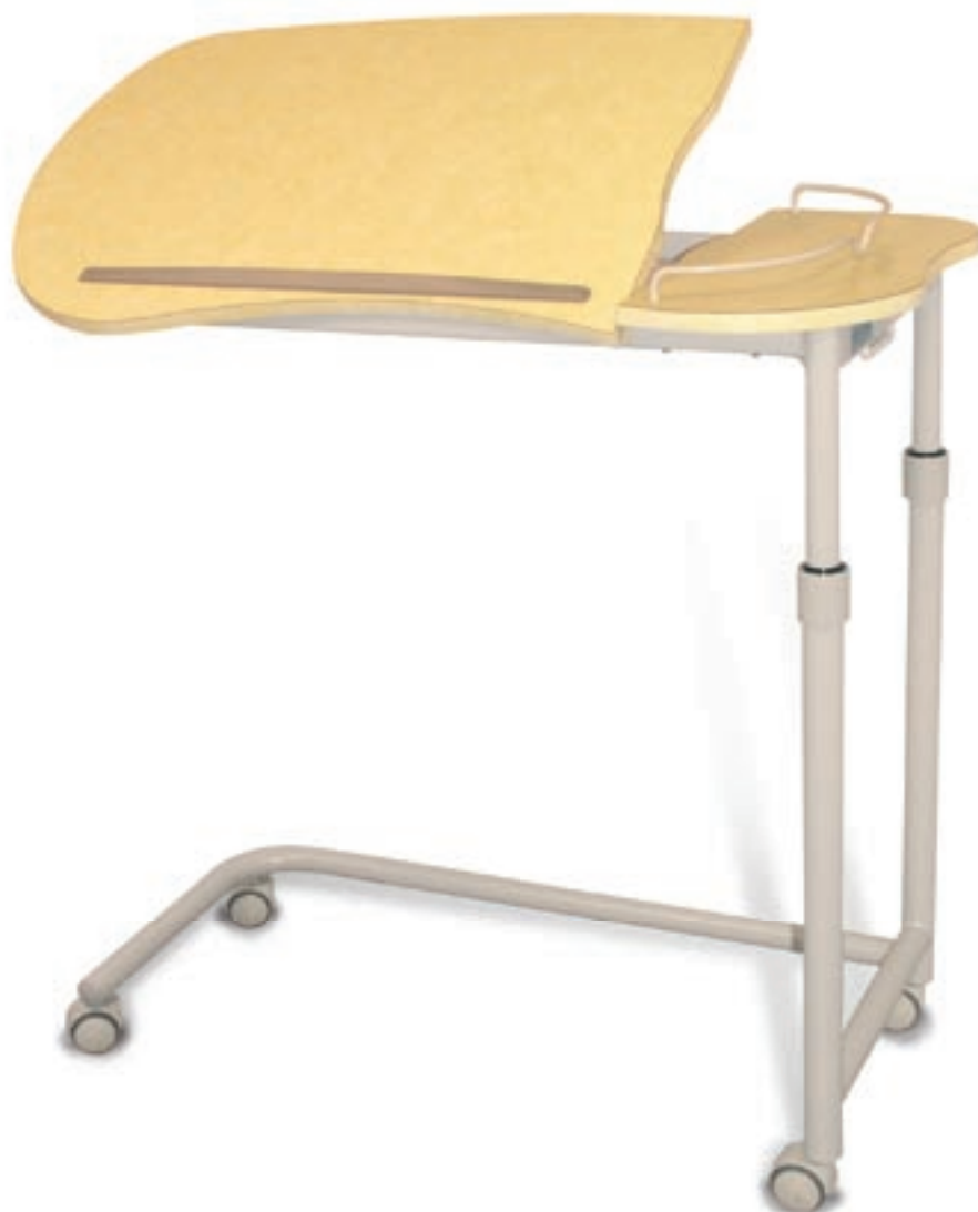
Table de lit TA 529