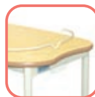
Table TA 529 H : 1 plateau fixe en médium, dessus plaqué stratifié.