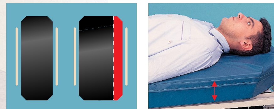
Option couchage extra-large