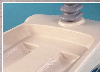
Nettoyage facile et rapide