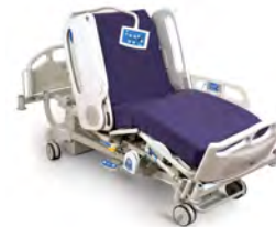
AvantGuard® LI158Ax/LI159Ax LI158Bx/LI159Bx