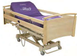
AvantGuard® 800 LTC LI801Ax