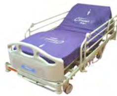
AvantGuard® 800 LI800Ax