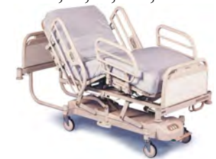
Evolution™ LI156 A, B, C, Dx, Ex