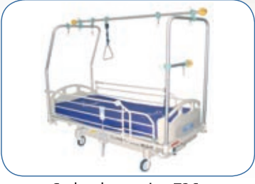
Cadre de traction T26, CKCT26