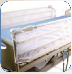
Filets de sécurité, AD205A*