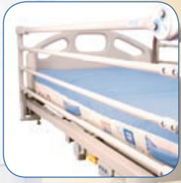
Barrières latérales, AD195AS2*