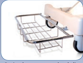
Panier de rangement tête de lit, AC937A*