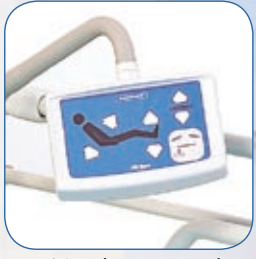
Boîtier de commande sur bras flexible, AD200A