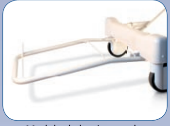
Module de butée murale, AD192A*