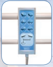
Boîtier de commande filaire, AD201A*