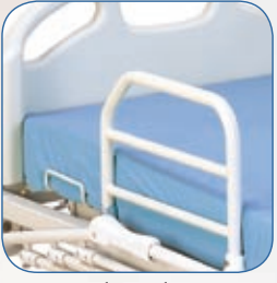
Barres de préhension, AD196AS2*