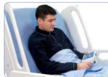
Confort et autonomie pour le patient