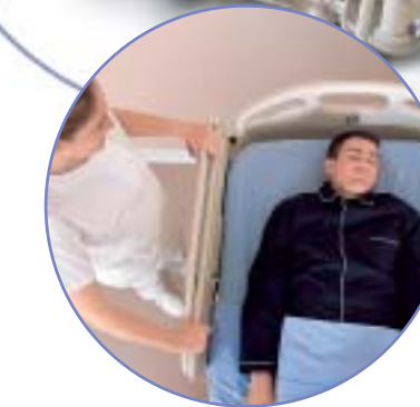
Les barrières TotalGuard s'ajustent automatiquement en un seul mouvement pour s'adapter à une large gamme de matelas.