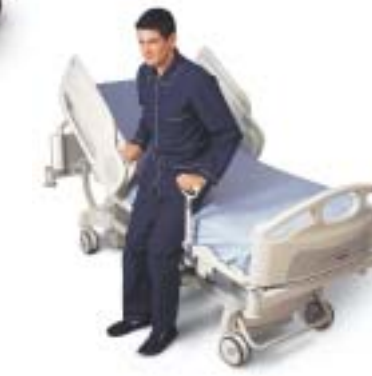
Poignées de préhension MobiBar