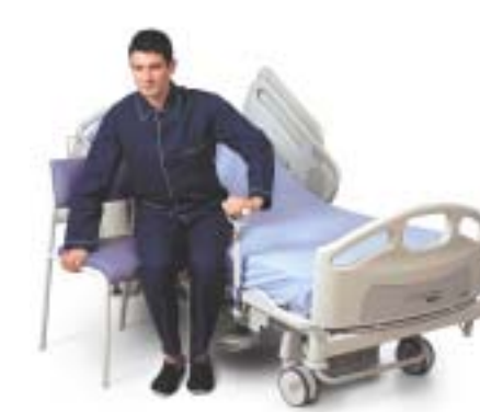
Position basse à 40cm