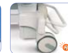
Alarme de sécurité frein engagé