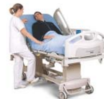
Ajustement au pied de la hauteur variable