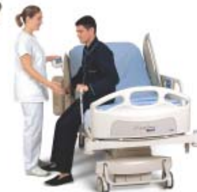
Aide à la mobilisation

La position EasyChair™ permet au personnel soignant d'asseoir rapidement et sans effort le patient par simple appui sur une touche, ce qui accélère son rétablissement.